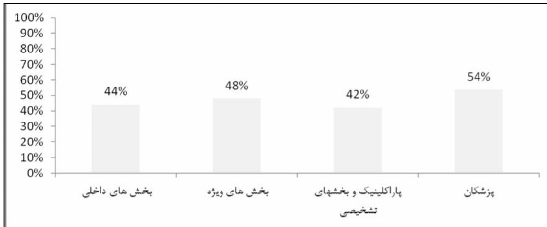
نمودار شماره ۲: مقایسه امتیاز اختصاص داده شده به "پاسخ غیر تنبیهی در قبال رویداد خطاها" توسط گروه های مورد بررسی