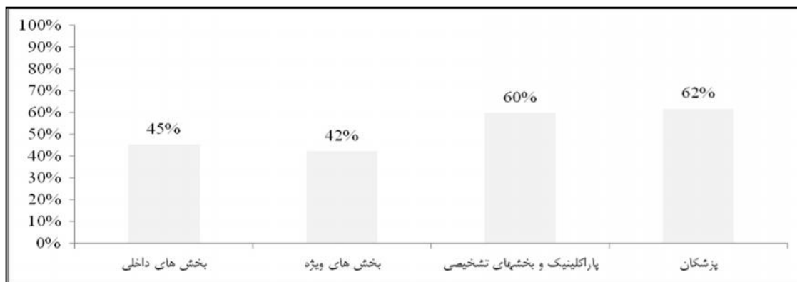
نمودار شماره ۲: مقایسه امتیاز اختصاص داده شده به "مسائل مربوط به کارکنان" توسط گروه های مورد بررسی